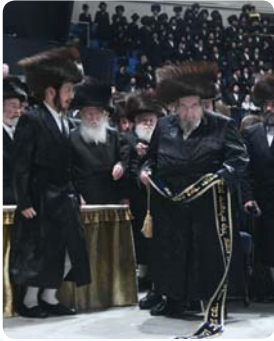
מנהיג ישראל המנורה הטהורה מרן הרבי מבעלזא שליט"א רוקד ריקודיו של מצוה במצוה טאנץ

טוב עין הוא יבורך. תודה לצילם אושילי בעק