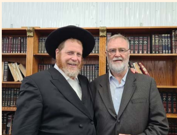
הגבאי של בית הכנסת ב"אהל" של האדמו"ר מליובאוויטש זיע"א בניו יורק, נראה עומד בשבוע שעבר לצידו של עורך העלון וכותב השורות שחיי

השיב בחיוב. הגשתי לו כיפה, טלית ותפילין והוא החל להתפלל איתנו. בתום התפילה, סיפר לי אותו יהודי שהוא הגיע לכאן מדרום אמריקה. הסיבה להגעתו היא בכדי להודות לבורא עולם ולשלוחו הנאמן כ"ק האדמו"ר מליובאוויטש זיע"א, על הישועה שהוא ואשתו זכו לה. ומה היא אותה הישועה? ובכן, במשך שנים רבות הם ציפו לפרי בטן. בשלב מסוים, הרופאים הודיעו להם שעל פי דרכי הטבע, אפסו הסיכויים שיזכו לחבוק ילדים. בצד להם, הם פנו לשליח חב"ד אשר עושה גדולות ונצורות בענייני היהדות במקום מגוריהם. לאחר שסיפרו לו על מצוקתם וצרתם, התוודו בפניו שהם לא נשואין כדת משה וישראל. הבעת בהלה, התמהות ופלצות השתקפה על פניו של אותו השליח לשמע הידיעה הזאת. ואז כשהתעשת מעט מתדהמתו, הצהיר בפניהם שבאם הם יינשאו על פי ההלכה היהודית, הוא יזכיר את שמותיהם בציונו של הרבי זיע"א ובעזרת ה' יתברך יזכו לישועה.