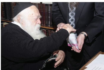
רבינו משלש כסף במעטפת צדקה

ורח"ע לא ענה לו במפורש על השאלה, רק השיב לו בסיפור, וכך אמר לו: מלפנים כשהייתי רב בעיירה 'איוויא', הייתי מקדים שלום לכל אחד מהתושבים. לימים נעשיתי רב בעיר הגדולה וילנא, וראיתי שאם אֹמַר שלום לכל אחד, אין לדבר סוף ולכן הפסקתי!.