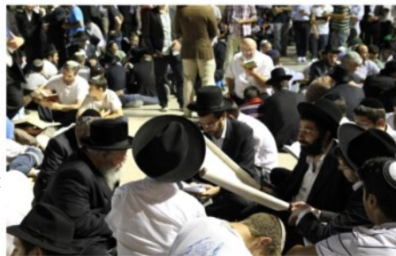
תשעה באב במחנה המנוחות, ירושלים: זקוק למורשת הכותב