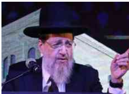
כמנהג עשיית מלאכה.

תשובה: אמנם יש שנהגו (ברכי יוסף תקנט, ז) לא למחות בנשים המסדרות ושוטפות את הבית אחר חצות, כחזוק האמונה בזמן לידת המשיח (איכה רבה א, ג) לקראת הנחמה בגאולה הממשמשת ובאה, אך הרוב לא נהגו לשטוף, ואף בעדות המזרח (ילקוט יוסף מועדים תקפו), ושמעתי מרבינו הגר"ש אלישיב לאסור אף על-די נכריה. ולמרות שאיסור עשיית מלאכה הותר לאחר חצות היום, בכל זאת בשטיפה יש שמחה יתירה, וכפי הנראה מאותם שאסרו אף בתשעת הימים לשטוף את הבית (מעשה איש ה, כא. ובשו"ת שלמת חיים שלב בשם הגר"ש סלנט), ואף שהתיר לשטוף בתשעת הימים שטיפה קלה, קל וחומר הוא לתשעה באב.