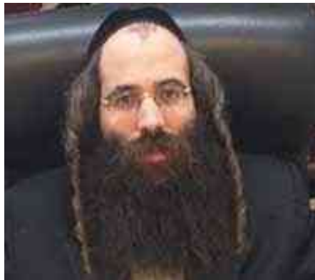
ברגן-בלזן ראויים להיקרא 'חיים'...

עיניו של הרבי נעצמו בדבקות, והוא השיב דברים כהווייתם: 'דעתי שאין לי סיכוי בכוחותיי הדלים. לכן כשקפצתי, משכתי את ידיי קדימה וחשתי כאילו אני אוחז בשולי טליתו של אבי, ואבי אוחז בשולי טליתו של זקני, וכך הלאה - כל דור ודור בהיסטוריה שלנו מחזיק בדור הקודם, עד אברהם, יצחק ויעקב המחזיקים בכיסא הכבוד. חשתי שכל הדורות מושכים אותי כשרשרת חזקה קדימה, וכך צלחתי את הקפיצה...' את הסיפור סיפר אותו חשמלאי יהודי, שזכה לשוב בתשובה שלימה ושב לכור מחצבתו, ומפיו פורסם הסיפור בגיליון הנפלא 'אמרי מנחם', כדי ללמדנו: בעולם מלא באתגרים ובניסיונות, אין לנו כח ועוצמה לעמוד בניסיונות, אלא להחזיק חזק בשולי הגלימות של הדורות הקודמים, ולמלא את עצמנו בכוחות וגבורה כדי להתגבר על כל הניסיונות