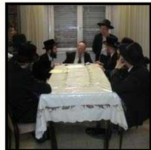
רבני 'קביעותא' בהתייעצות בביתו של מרן צוק"ל - כ"ג מנ"א תשנ"ד