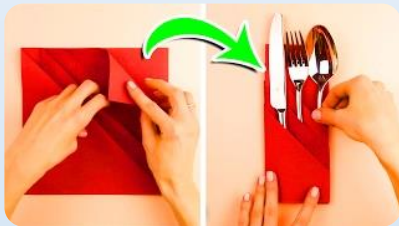
סידור מפינונים לשולחן החג