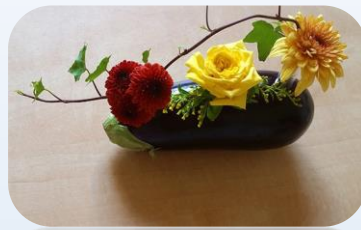
פרחים בתוך חציל.