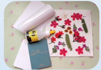
נייר דבק ופרחים מיובשים.