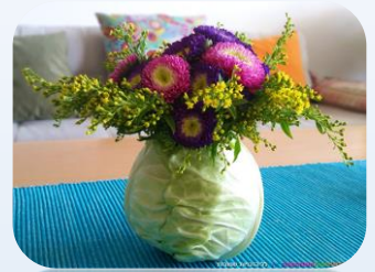
עציץ בתוך ראש כרוב.