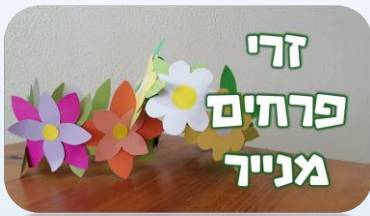
זר פרחים מנייר.