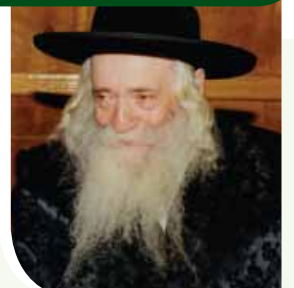
רבי מצאנזקלויזנבורג, בעל 'שפע חיים' זצ"ל