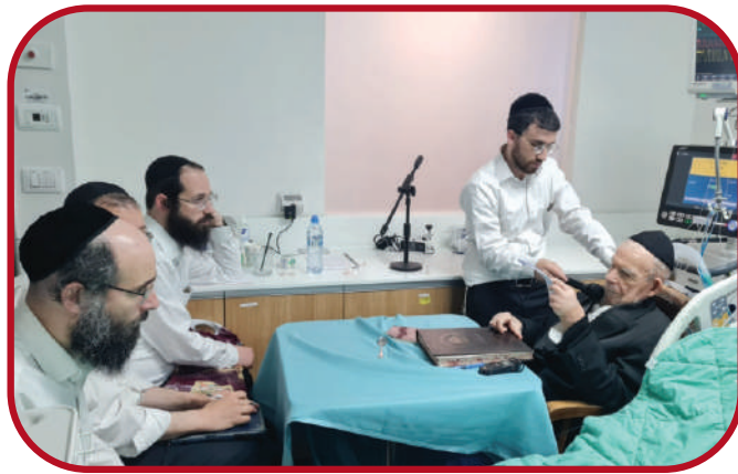
עד היום האחרון, הרב אדלשטיין זצ"ל בשיעור האחרון, יום לפני פטירתו