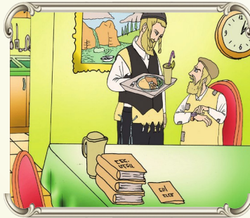
אדם שחושב שהכל מגיע לו, תמיד הוא יתלונן למה לא לו את הכל

אין אדם שיש לו שלמות בעולם הזה, לכל אחד ואחד יש קשיים ובעיות, אם זה בעיות בפרנסה עם פרנסה, עם שכנים, או עם חברים או בבית, וכן הלאה. לכל אחד ואחד ה' שולח קשיים, וזה הנסיון שלנו, ואנחנו צריכים להסתכל על הצדיקים שבכל הדורות וכן על הצדיקים התלמידי חכמים שבדורנו, היא לקנות ענוה והכנעה מהקשיים, להתבונן בכל הטוב שיש לנו ולא לחיות רק את הקשיים.