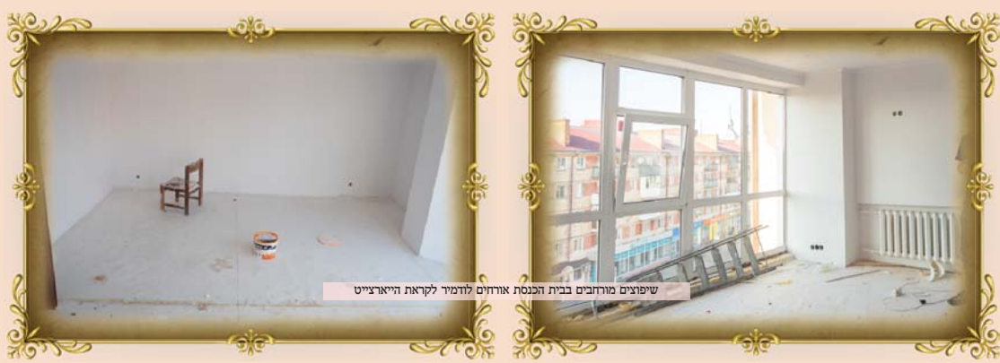
שיפוץ מרחבים בבית הכנסת אורחים לודמיר לקראת היארצייט

להעברת קויטל ולקבלת הקמיע הנדיר חייגו כעת: 04-3010-900