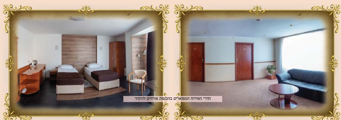
חדרי ואירוח המפוארים בהכנסת אורחים לודמיר