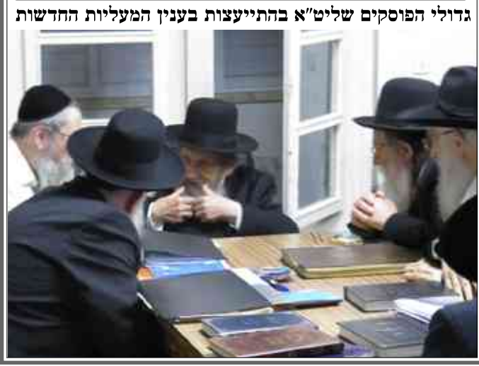
גדולי הפוסקים שליט"א בהתייעצות בענין המעליות החדשות