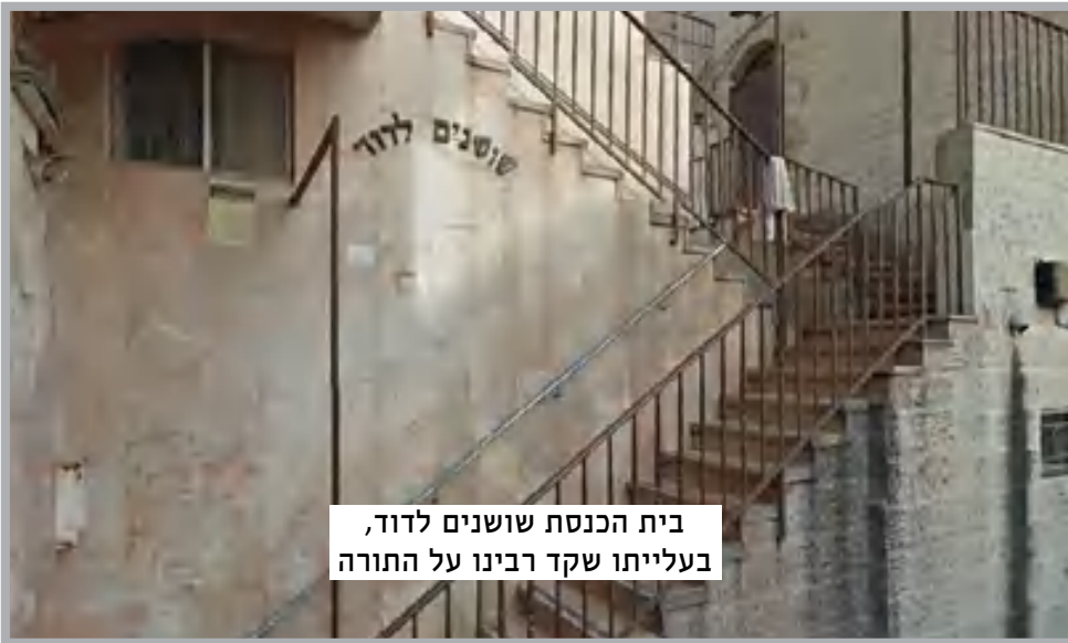
בית הכנסת שושנים לדוד, בעלייתו שקד רבינו על התורה