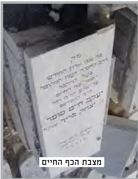
מצבת הכף החיים

דרכו של הכה"ח שכשבא לחלוק או לאפוקי מדברי האחרונים שאינו סובר כמותם, לא מביאם בשמום המפורש אלא כותב בסתם והמבין יבין והבוחר יבחר. ואף כתב בזה תוכחת מוסר בכף החיים (סימן תקמ"ה ס"ק ע"ט).