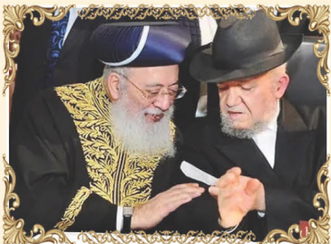
ראש ישיבת "כסא רחמים" הרב מאיר מאזוז שליט"א עם הראשון לציון ורבה של ירושלים הרב שלמה עמאר שליט"א