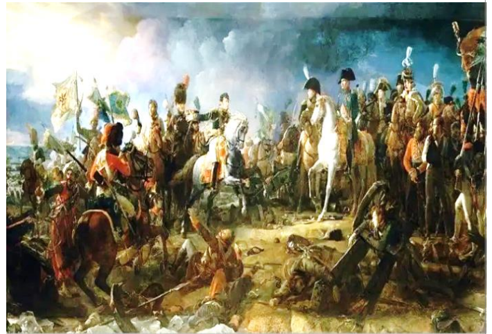
נפוליאון בקרב אוסטרליץ, ציור מאת גוסטב דאנדר

ניגש הנסיך אל האיכר ותמה באזניו: לי ארבעה סוסים אבירים ומיוחסים, ולך שלשה סוסים צנומים ודקים. ובכל זאת דוקא אלו שלך נחלצו ברגע אחד מן הבוץ, ואילו שלי כבר שעות מתבוססים בבוץ ואיננו יודעים כיצד נחלץ מצרה זו.