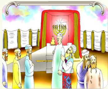
מצות הנפת הלויים מלפני שפאשר אדם נאמן הוא מליד את השני ואינו מרגיש שזה בא על חשבוננו...

פרשה נפלאה זו צריכה להיות נר לרגלנו: כל אחד עובר בחיים זמנים של קשי, והעבודה שלנו להיות מהתלמידים של משה, להשאיר נאמנים לה', ולא להגרר אחר המתאוננים שראו תמיד רע. אדם שהוא כפוי טובה, יבליט תמיד את החסרונות ויחפש תמיד מה יש לאחרים יותר ממנו, ותמיד הוא ימצא ויחשב למה אין לי מה שיש לאחרים.