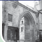
שער העיר העתיקה בקורביל [קורביל - סיון]