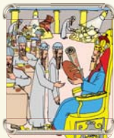
לקנות נאמנות לבורא בכל מצוה ולמנוח

שתיקה בוד סוד שאינו מאבד טפה, הוציא מתוך דברי רבותיו, שהעקר זהו עין טובה, שתוכל טוב על כלם! תראה את הטוב שבצעמך ואת הטוב שבכל הסובבים אותך! אל תעשה עסק מאשות! אל תחליש דעת של אשתך בגלל טעות קטנה, גם אם אתה צודק, האם שוה לך לצער את בני ביתך שעושים ונותנים לך כל טוב שבעולם, האם זהו הגון להחליש דעת למי שעושה לך כל כך הרבה טוב?!