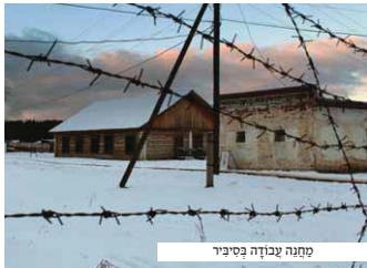
מחנה עבודה בסביבי

הייתי באפיסת כחות, וכמעט נבנתי לקול שהיהד בתוכי. כאשר לא הייתי מסוגל יותר לסבל, זקמתי בתפלה לה: 'דבוננו של עולם, רחשו שפתי, יעור לי! איניי מסוגל יותר להלחם, עשיתי והתאמצתי למען כבוד שמך, וכחותי כבר אזולים. אגא ה, יעור לי שלא אאלץ לחלל את השבת.'