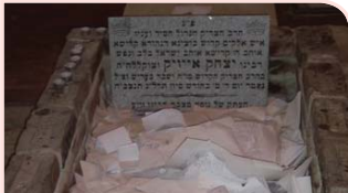
מצבת הרה"ק רבי יצחק אייזיק מזידיטשוב זיע"א

אחוזת הפאר שעמדה בלב ליבה של פוליאנא [פוליאנוק], הייתה בולטת במיוחד בין בתי הנמוכים של העיירה הקטנה והשקטה. מגדליה המתנוססים וגגותיה האדומים של האחוזה הגדולה ורחבת הידיים, היו מוכרים היטב לכל יושבי המקום היהודיים ולתושביה של העיירה מונקאטש [מוקציבו] השכנה.