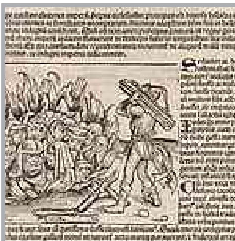
הציור המקורי, בתוך ספר עתיק, שמספר על שריפת היהודים בתוך שוחה במסגרת פרעות המגיפה השחורה

קידושין (פ"א סימן יב) כשהוא מפרש דברי התוס': וכן מצאתי להדיא בפסקי תוספות,