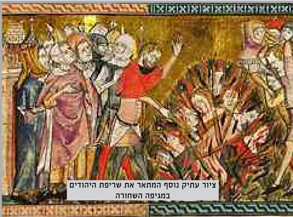
ציור עתיק נוסף המתאר את שריפת היהודים במגיפה השחורה

התורה באשכנז לימי זהרה. יש הרואים בגזירות אלו את סיום תקופת הראשונים, עכ"פ באשכנז (בספרד עדיין נשאר בדור שאח"ז הר"ן ותלמידיו שהמשיכו את מסורת התורה כבימי קדם). כחמישים שנה אח"כ החלו המהרי"ל ובני דורו לבסס מחדש את הישיבות, לשמר את המנהגים והמסורות וכיוצ"ב.