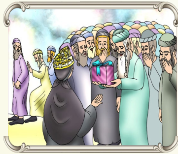
כאשר רבי יצחקא נתן לאשתו תכשיט של יהושלים מזהב כמו שאמר לה...

חז"ל אומרים: (חלין פט.) "מה אמנותו של אדם בעולם הזה, ישים עצמו כאלם". גם אם אתה רואה שחברך לא נוהג כמוך, גם אם מישוהו הולך בדרך אחרת משלך, זה לא אומר שהוא טועה, לא צריך להגיב ולהוכיח. וזה לא רק אצל החכמים שסביבנו, גם בתוך הבית צריך לנהוג בחכמה, איך וכיצד להעיר לא מתוך התפרצות ולא מתוך כעס, ואדרבא, דוקא כאשר מעירים בהרגשה ובאופן חיובי, הדברים הנאמרים, מתקבלים ומתישבים על לב השומע.