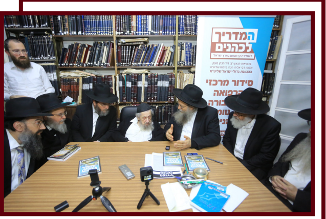
רבני הארגון בהתייעצות אצל מרנן הגר"ד לנדו שליט"א