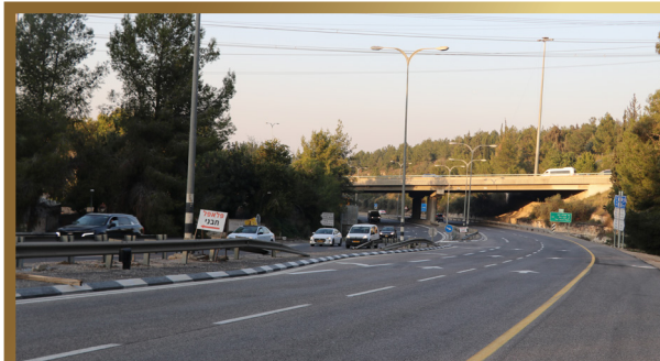
כביש 444 מצומת גמזו לכיוון אלעד הנתיב השמאלי נסלל מעל לקברים

בהתאם לכך מתבצעת העבודה מול בתי החולים כדלהלן, ראשית, ממפים את בנייני בית החולים, ובודקים איזה בניינים מחוברים, ולאן מחוברים, האם מחוברים למקום שיש טומאה, ואם כן האם החיבור קבוע או זמני. יתכנו מקרים שרשת צינורות שמעבירה בדיקות דם, חמצן ועוד, יכולה לחבר קמפוס של שלם עם כמה וכמה בניינים, שבחלקם מצד עצמם אין כלל בעיה, כמו מרפאות חוץ, מחלקת יולדות וכדומה, אך מכיוון שהם מחוברים יחד עם חדרי המתים למשל, הטומאה מתפשטת גם בבניינים אלו.