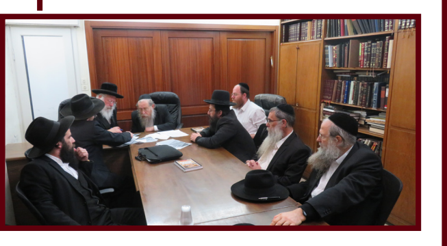
רבני הארגון בהתייעצות עם רבני בני ברק