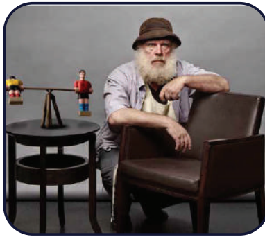
זו שליחות בעיני! הצלם קובי קלמנוביץ

"פניתי אליו ושאלתי אותו אם יסכים להניח תפילין. הוא, שהיה עסוק כל הזמן במצלמתו, מצלם וידאו ללא הפסקה, העיף בי מבט וסירב. ניסיתי שוב והוא סירב. פניתי אליו ואמרתי לו: 'זוכר את הבקשה שלך לצלם פורטרטים אצלי? הנה ההצעה שלי: תניח תפילין והפורטרט שלך עליי, בחינם'."