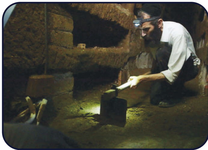
פעלו בכל האמצעים להצלת הקברים. אחד מהארכאים בפעולה במערה