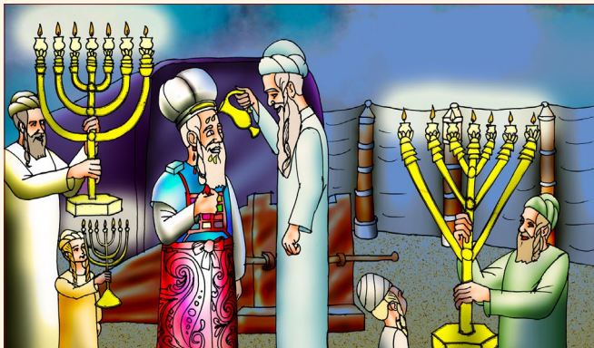
מה פרמי בשמן המשקה ובדם הקרבו שעמקה משויו את אהרן ובניו?

על כך במאמר: 'מתיקות המדות הנלמדות מהבגדים'.