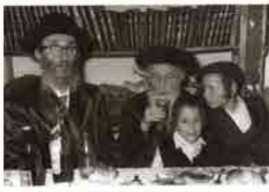
שני משמאל גאב"ד תל חנן זצ"ל בשמחת הבר מצוה של כ"ק האדמו"ר משאץ וויז'ניץ שליט"א בהשתתפות כ"ק האמרי חיים מויז'ניץ זצ"ל