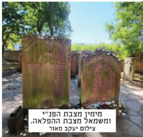
מימין מצבת הפנ"י ומשמאל מצבת ההפלאה.