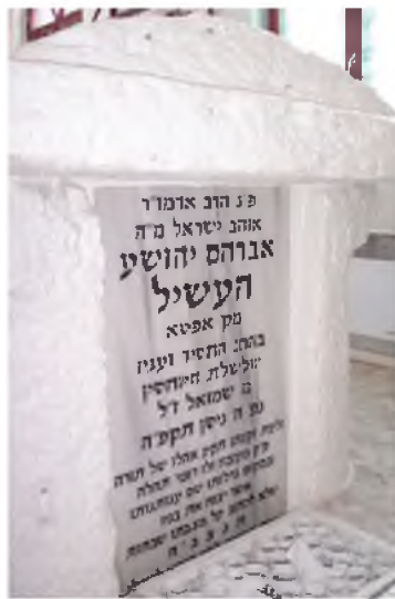
מצבת קדשו של בעל האוהב ישראל' בקז'יבוי

הדרך חזרה היתה קשה ורצופת מכשולים וסכנות, ובמהלכה תעה הסוחר בדרך ולא הצליח למצא מוצא. מזונו אזל, והוא סובב על פני השטמה בדרגה מפני המות שעשוי לפוקדו בקרוב... אלא