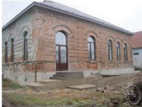
בית מדרשו של בעל האוהב ישראל' מאפטא