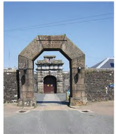
השער הראשי של בית הפלא דרטמור באנגליה

בלילה ההוא נדה שנת השופט שטפל בתיקו של ר' יהודה. השופט התקשה לקבל את החלטתם של חבר המשפטים, לדידו לא היה סביר להטיל עניש פה כבד על העברה שבצע ר' יהודה. באותו הלילה הוא התחבט בדבר, ובבוקר הוא החליט להתקשר מיזמתו לעורך הדין שייצג אותו, ואמר לו שברצונו לשבת ולעזיב שוב בפסק הדין.