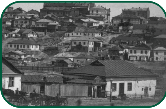
דאג למחסורם של העניים באומן. העיר אומן בימים עברו

מאוחר יותר, בשנת תרצ"ו, כשהקלויז נסגר על ידי שלטון הבולשביקים והוסב למטרות חולין, אמרו חסידי ברסלב: "הקלויז לבטח עוד ישוב לדיננו, ולו רק כדי