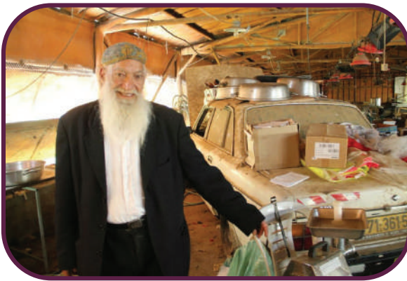
חי' הרבה מעבר לתחזית הרופאים. רבי עובדיה ז"ל במירון

גם מול גורמי חוק אטומים ואביירי-לב נדרש רבי