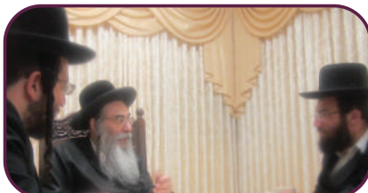
ההנהגות נחקקו בלב. הרבי מאלכסנדר שליט"א בשיחתו ל"ניצוץ"