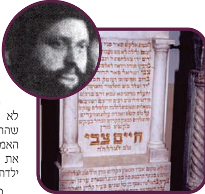
בדק ללבג. ציונו ותמונתו של ה"עצי חיים"

הפאה מצידה עמדה מיומת בצד הארון, ומידי פעם