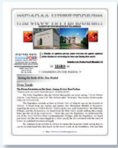
Meoros Hatzadikkim Dvar Torah & Weekly Yahrzeits (English) Ramapost.com/meoros-hatzadikkim

Please fill out the online form at RAMAPOST.COM/SUBSCRIBE-DIVREI-TORAH to subscribe. We ask that your free printed divrei torah be picked up every Friday at our Monsey (Rt 59) or Wesely Hills/Pomona location.