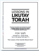
Likutay Torah (English)