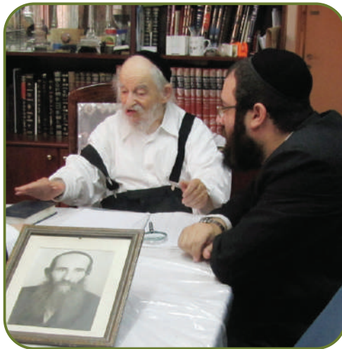
אמונה של ברסלב'ר חסיד. חתנו הגר"י גלינסקי בשיחה ל'ניצוצות'

"הנה מה עושה השווער שלי? פותח שם הכנסת אורחים ליהודים חרדים מרחבי ברית המועצות, אנשים שלא היה להם רישיון שהיה במוסקבה, אנשים שברחו מהנקוד ומכל מיני בעיות אחרות, הגיעו לשינת לילה אצל השווער, הוא הכניסם למרות הסכנה האישיית שלו, היות והאמין שמצווה לא מפסידים. יתירה מזאת, הוא הביא לשם ספרי לימוד, הוא פתח שם ממש ישיבה..."