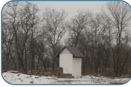
"יצונוה החכמנית המהוללה"... האוהל על קברה בקרמנצ'וג

הצדקת מרת שרה נפטרה בצעירותה בכ"ז כסלו תקצ"ב [היארציית יחול ביום רביעי בשבוע הבא]. "ויהיו שני חיי שרה ארבעים ושנים שנה, כולם שווים לטובה". (מגזין 'ניצוצות' כסלו תשע"ה)