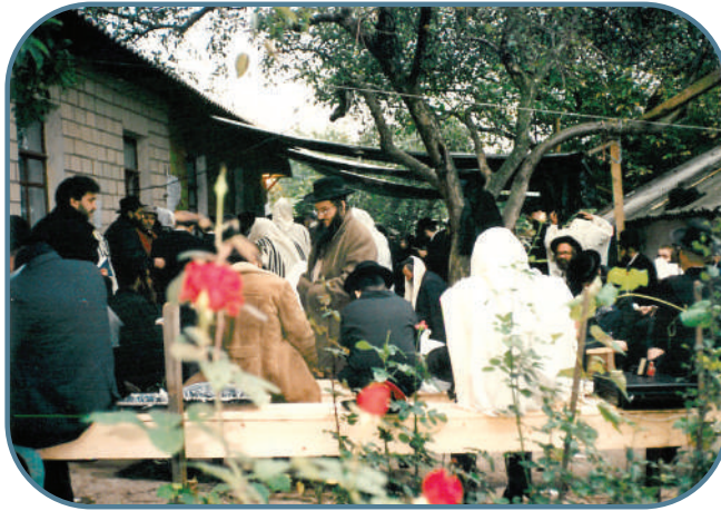
נסיעות בכל מחיר. חסידי ברסלב באומן מיד נפילת מסך הברזל

האחים נלקחו למעצר כשלמעשה אין להם שום דרך לדעת מתי יצאו משם ואם בכלל. בחלוף שעה ארכה של מתח הם התבקשו לצאת מהחדר ונלקחו לחדר החקירות. אחי מספר שאלות, כאשר הסבירו שהם אינם מורגלים אלא אך ורק רצו להגיע