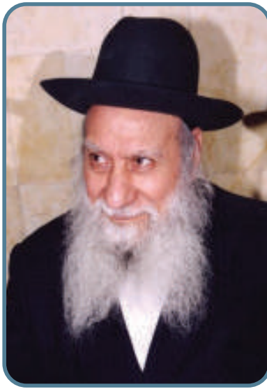
אף מילה לאף אחד. המקובל רבי שמואל דרזי

כעבור תקופה קצרה לא היה ניתן להכיר את פני הבחור. כרינתו, שהתרגלה לספוג דמעות אכזבה וגעגועים לאמא היקרה ע"ה, החלה לקבל אותו מותש ומלא סיפוק, ובשניות הבודדות עד שנדרס דמיין את אמו מלאת אושר ושמחה על כי טוב לו לבנה בזה העולם.