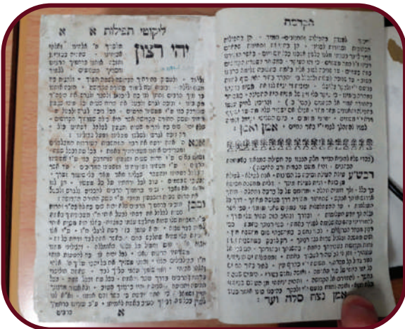
סיפור של תפילות ה'ליקוטי-תפילות' שהודפס בבית רבי נתן