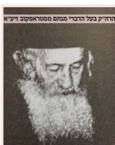
הרה"ק בעל הדברי מנחם מסטראפקוב זיע"א

לרגל האירצייט ה-208 של הרה"ק רבי יחזקאל שרגא משינאווא זיע"א בן הרה"ק רבי חיים מצאנז זיע"א - ו' טבת תקע"ה. (עי' ספר עבודת עבודה)