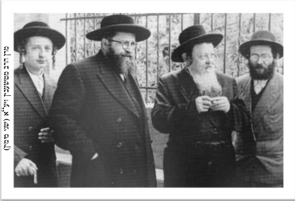
מייזן הרב מטשעבין זצ"ל (שני מימין)