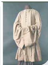
The cloak of Rav Shlomo Molcho, on display at the Jewish museum in Prague.

מכן הוא מזכיר שראה במו עיניו את הציצית של ר' שלמה מלכו מוצגים בבית הכנסת פנחס בפראג, שם למד לפני שנתמנה לאב"ד.