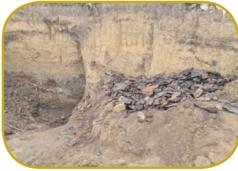
בתוך מחנה צבאי עתיק. אחת מערמות הנעלים בבורות שנמצאו

עד היום אותו ונחפרו 3 בורות הריגה, ולפי ההערכות קיימים במקום עוד שישה או שבעה בורות הריגה. לדברי מומחים מקומיים, מספר הנרצחים נע בין אלפים לעשרות אלפים, חלקם הגדול יהודים.