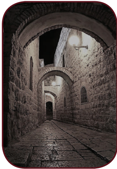
לילות אוכים של עבודת השם. העיר העתיקה בירושלים