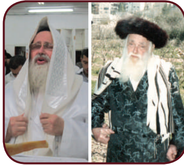
היה מקרב במיוחד. הגר"ב חשין והגר"ב בצרי

אימי ע"ה, שמנהגה היה ללכת בכל שבוע ביום חמישי לבית הכנסת הקטן "משכיל אל דל" שבשכונת בית ישראל בירושלים, שם הרב החסיד רבי בנימין זאב (וועלויל) חשין זצ"ל [יום פטירתו י"ז חשוון תשמ"ט] היה נותן שיעור שבועי בשפה קולחת ומיוחדת בליקוטי מוהר"ן. בשיעור היו משתתפים כשני מניינים לערך וכן כמה נשים בודדות וביניהם אימי ע"ה, ומאז היתי בגיל חמש הייתה לוקחת אותי עימה.