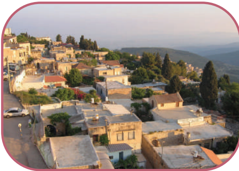
עסק בה בתורה ללא הפסקה. העיר צפת

"אחר התפילה ישב בטליתו ותפיליו עד שעה עשירית, אז הלך לביתו לאכול ארוחת הבקר, ואח"כ לבית מסחרו ביחד עם בנו – חותני הנזכר. בשנות מלחמת