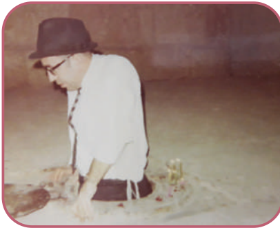
ולא ידע מה ניבא. ר' צבי אריה בציון שמואל הנביא

משלא הייתה ברירה, הזעיקו נציגי ה'אינטוריסט' למקום את... ראש העיר של אומן, נציג השלטון הקומוניסטי, האמון בכל נפשו לכבות כל גחלת לחשת של יהדות, הוא