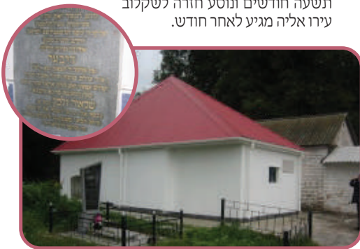
פֶתַח חֲנוּת, בהצלחה. המצבה והאוהל על קברו של רבי דובער

"שמעת פעם על העיר שקלוב? בשקלוב יש סוחרים גדולים, ובלייפציג שבגרמניה יש יריד גדול הנמשך על פני תשעה חודשים תמימים. נוסע הסוחר השקלובי לליפציג בנסיעה ארוכה הנמשכת חודש תמים, שוהה בליפציג תשעה חודשים ונוסע חזרה לשקלוב עירו אליה מגיע לאחר חודש.