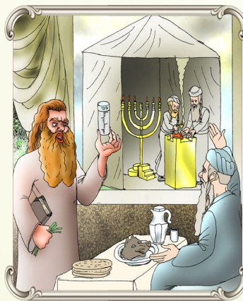
עשו לא השכיל שדוקא ההכנעה שלו לפני יעקב זו ההצלחה שלו

לפעמים אדם מחפש לעשות מצוה על חשבון השני, או שאדם נכנס הביתה והוא בלחץ לקיים איזו מצוה שהוא בטוח שזה רצון ה' עכשו, והוא מתרעם על כל בני הבית שלא עוזרים לו מספיק ולא נוהגים כמוהו. ברם האמת שרצון ה' שדוקא לא יעשה את המצוה תקף ומיד אלא שיכנס עם שלוה ומאור פנים הביתה. ועל זה אדם יקבל עולם הבא הרבה יותר גדול, כי זה הנסיון שלו.