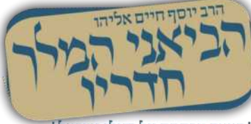
הצצה מרמקת על גדולי ישראל

כשהיה בגיל 4 נפטרה עליו אימו בדמי ימיה בשנת 32 לחייה, וכשהיה בגיל 11 נפטר עליו אביו. וכבר בקטנותו התבלט בכשרונותיו הנדירים ומוחו החריף, יהודי העיירה היו מכנים אותו בשם ילד הפלא, וכבר בגיל 6 היה בקי בכל התנ"ך, ובגיל 8 נבחן אצל אביו על כל מסכת כתובות.