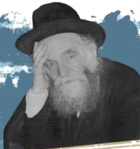
הגאון רבי אהרן קוטלר זצוק"ל ר"י לייקווד - ב' כסליו תשכ"ג

בהיותו בליטא התאפשר לו להימלט מידי הנאצים, הוא התלבט האם לנסוע. לארץ ישראל או לארה"ב, ולא עלתה בידו החלטה. רבינו ערך גורל הגר"א והפסוק עלה "ויאמר ה' אל אהרן, לך לקראת משה המדברה" מיד הבין שיש רמז לשמו והכוונה: "לך לקראת משה המדברה" שהוא רבי משה פינשטיין זצ"ל, שגורש מרוסיה והיגר לארה"ב שהיתה אז ככמדבר מבחינה רוחנית, ואכן רבינו הגיע לארה"ב ובזמן קצר הקים את ישיבת ליקווד.