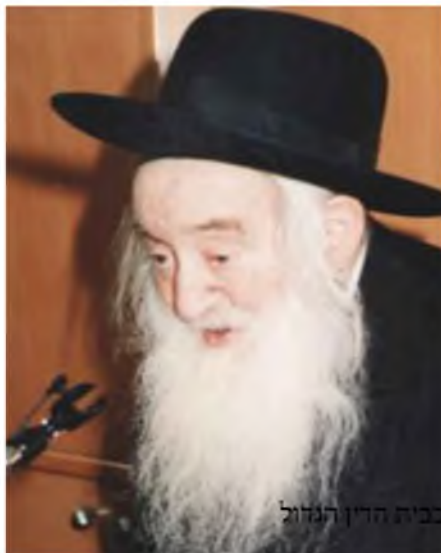
בית הדין הגדול

ההלכה להורידו מהמיטה לרצפה, הכריזו שרק מי שטבל במקווה יעשה זאת. והיות ורק הוא טבל, היה היחיד שהורידו. לימים אמר שהיה זה