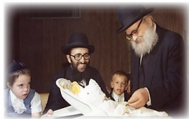
Rav Yaakov Kamenetsky zatzal with Yb"l Rav Shmuel Kamenetsky shitta