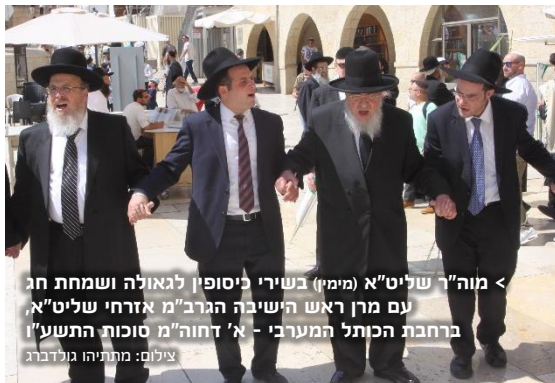
< מוה"ר שליט"א (מימין) בשירי ליסופין לגאולה ושמחת חג עם מרן ראש הישיבה הגר"מ אזרחי שליט"א ברחבת הכותל המערבי - א' דחור"מ סוכות התשע"ו

ולכן יש בחודש זה מצוות רבות כדי שנוכל להתעלות בדרכי האבות הקדושים שכל השתוקקותם הייתה לקיים מצוות, ובסופו שמחים עם התורה שהיא תכלית כל הבריאה ועליה אמרו חכמים במשנה פאה (פ"א מ"א): "ותלמוד תורה כנגד כולם" - וכמה ראוי לסיים עם חג שמחת תורה את החודש הזה שהוא חודש של התעלות והליכה בדרכי האבות הקדושים. יה"ר שנזכה לנצל חודש זה כראוי, ונזכה להיכתב ולהיחתם בספרן של צדיקים גמורים בעז"ה, אמן.