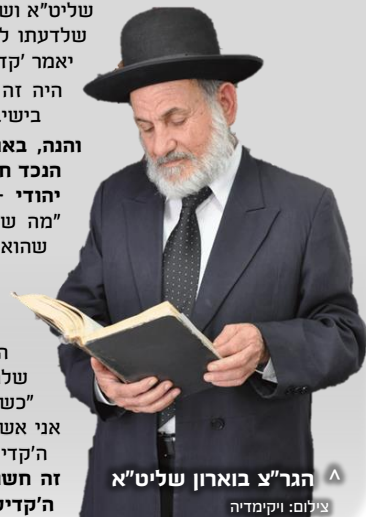
▲ הגר"צ בארון שליט"א

הנכדה לא הבינה למה התכוון הנפטר, ובשבת בבוקר סיפרה לסבא שלה [הגר"צ] את דבר החלום. "כששמעתי כן אמרתי לה: 'אוי ואבוי, אני אשם. אני אמרתי לו להפסיק לומר את ה'קדיש'. אבל עכשיו אנחנו מבינים כמה זה חשוב, ואין דבר שחשוב לנשמה כמו ה'קדיש', לכן צריך להיזהר בה!"