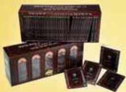
פורמט כיס "ובלכתך בדרך" מהדורת ר' יוסף צבי בערנער (cm 16.5/11.5)