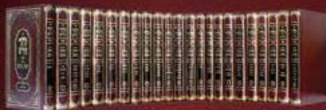
פורמט רגיל (cm 24/17)