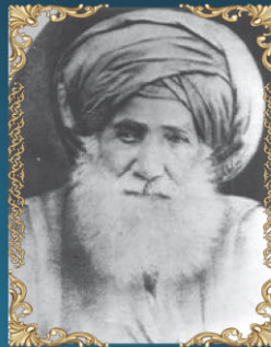
הרב עבדאללה סומך י"ח אלול ה'תרמ"ט (1889) מנהיגה של יהדות בבל ורבה של גאוני ומאורי הדור הקודם