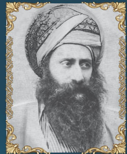
הרב יוסף חיים מבגדאד י"ג אלול ה'תרס"ט (1909) מקובל אלקי, מפורסי הדור הקודם, חיבר עשרות ספרים ומכונה ה'בן איש חי' ע"ש ספרו