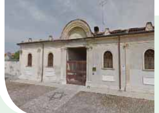
שער הכניסה לבית הקברות היהודי בבורנה