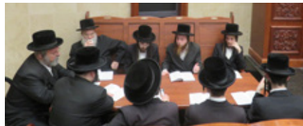
שיעור בספה"ק שערי תשובה בשטיבל בית שלום-אשדוד

המציאות מראה וכפי התגובות שלא מפסיקים להגיע, שעניין הסיכום היומי, מהווה בעצם בבסיס ויסוד לכל המעוניין להתקדם בתורה. וכפי שביטאו זאת רבים בקולם, שאחר הלימוד הם מתחברים למערכת 'תלמודו בידו' ואז ב 2 דקות שהם משקיעים לסיכום הלימוד, אז בעצם הם קולטים ומפנימים; מה למדנו היום!;