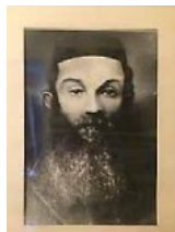
La photo du fils de rav Chelomo Kluger zatsal

הפסוק אומר עשו ספרים הרבה אין קץ, הכנת ספרים רבים ללא הגבלה (קהלת יב:יב). ר' שלמה קלוגר מסביר את עשות ספרים כהנחיה שמשמעותה לייצר ספרים רבים. למה? כי אין קץ, סיום הגלות שלנו עדיין לא הגיע. לאחר שהתקיימה מכסת הספרים שה' קבע שיש לכתוב, רק אז יכול המשיח לבוא. בואו של המשיח מותנה בספרים האלה שצריך לכתוב וללמוד.