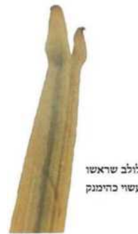
לולב שראשו עשוי כהימנק

בגמרא (סוכה לב ע"א) מבואר שלולב הסדוק פסול, ואמר רב פפא שסדוק הוא דעביד כהימנק, ונחלקו הפוסקים מה נחשב "עביד כהימנק", יש שפירשו שהוא כשנחלקו שני עלי התימות ונתרחקו זה מזה עד שיש חלל ביניהם 125 , ויש שפירשו שהוא רק באופן שנחלקו ונתרחקו עד שעומדים ראשיהם כפופים ומרוחקים זה מזה ונראים כשנים 126 , והלכה כדעה זו. ובטעם פסולו נחלקו הראשונים יש אומרים שהוא משום חסרון לקיחה תמה, ומטעם זה אינו פוסל אלא ביום הראשון בלבד 127 , ויש אומרים שפסולו משום חסרון הדר ומטעם זה לבני אשכנז פוסל הוא בכל שבעת ימי החג 128 .