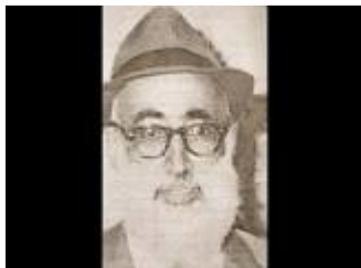
חכם שאול דוד חי מועלם

הוא נפטר בירושלים ונקבר בהר הזיתים בו' בחשון, ה'תשל"ט.