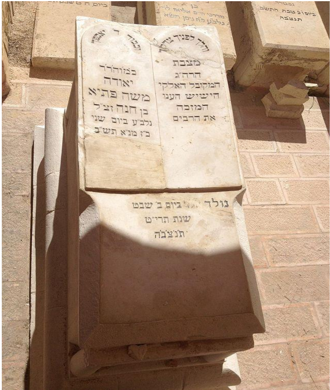
מצבת קבורתו במרומי הר הזיתים