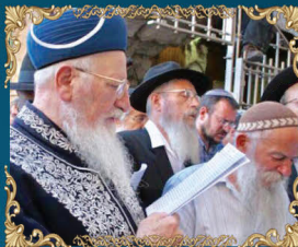
הראשון לציון רבינו מרדכי אליהו זצ"ל