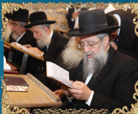
חבר מועצת חכמי התורה הרב דוד יוסף שליט"א