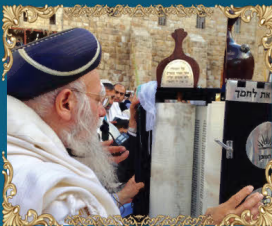
הראשון לציון רבינו אליהו בקשי דורון זצ"ל