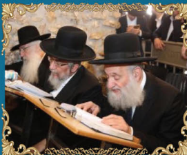
חבר מועצת חכמי התורה הרב ראובן אלבז שליט"א