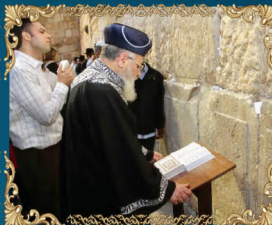
הראשון לציון רבינו יצחק יוסף שליט"א