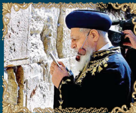
הראשון לציון מרן רבינו עובדיה יוסף זצ"ל