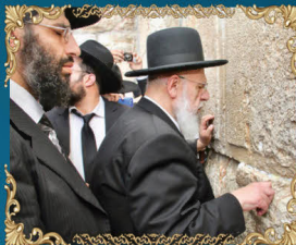
ראש מועצת חכמי התורה רבינו שלום כהן שליט"א